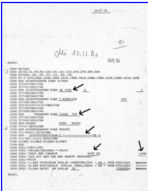
Ausdruck eines geisterhaft veränderten Programmcodes von Manfred Boden (Anklicken für größeres Bild)

Boden war übrigens ein klassisches Opfer von mißgünstigen Low-Level-Entities : Ihm wurden immer wieder bedrohliche Botschaften übermittelt, die seinen Unfalltod für den 16.08.1982 voraussagten – er ignorierte diese Aussagen und starb im Jahr 1990 an den Komplikationen eines (langjährigen) Herzleidens.